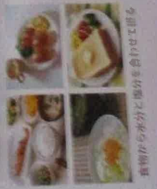
食物から水分と塩分を合わせて取る