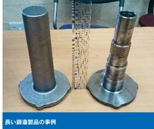
長い鍛造製品の事例