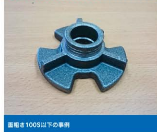
面粗さ100S以下の事例