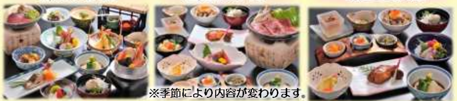
※季節により内容が変わります。