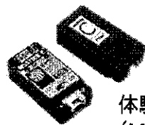
体験用機器 （M5 Stick C）