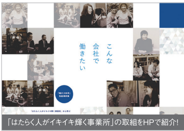
「はたらく人がイキイキ輝く事業所」の取組をHPで紹介!

豊田市は、従業員にとって働きやすく、働きがいのある職場づくりに取り組む事業所を、「はたらく人がイキイキ輝く事業所」として表彰しています。働きながら子育てや介護をしたり、趣味の時間を楽しんだりできる制度や社風の整った職場を探すヒントになります。ぜひ、「とよた産業ナビ」に掲載された特設ページもチェックしてくださいね。